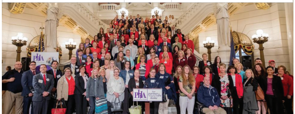
Los defensores del cuidado en el hogar se reúnen en los escalones del Capitolio en Harrisburg durante el Día del cabildeo de 2017, patrocinado por la Asociación de Cuidado en el Hogar de PA.